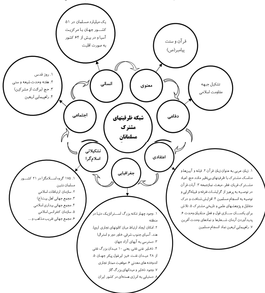
نمودار شماره ۲: پیوندهای شبکه‌ای ظرفیت‌ها با هدف انسجام مسلمانان

مسلمان‌نشین بی‌معنی است و باید همگام با تبدیل حکومت‌های ملت‌گرا به حکومت اسلامی، مرزها به‌صورت «باز و آزاد» در آید. (صدیقی / ۱۳۷۵: ۱۲۴) بر این مبنا بدیهی است که با شناسایی ظرفیت‌ها مختلف و ایجاد انسجام به‌شکل شبکه‌ای از ظرفیت‌ها مسیر وزمینه تشکیل امت مسلمان و از سوی دیگر هم‌افزایی که نتیجه انسجام بخشی است به تدریج به منصفه عینیت راه پیدا خواهد کرد. عناوین ظرفیت‌های مقدور مسلمانان در منطقه خاورمیانه و دیگر کشورهای مسلمان در پژوهش انجام گرفته توسط قوی بر مبنای دیدگاه امام خمینی (ره)، رهبری نظام و عملکرد جمهوری اسلامی ایران را می‌توانیم در نمودار شماره ۲ مشاهده کنیم.