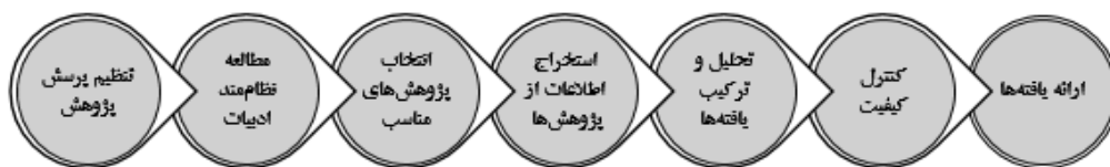
شکل شماره (۱): گام‌های فراترکیب در پژوهش حاضر (ساندالوسکی و باروسو، ۲۰۰۶)