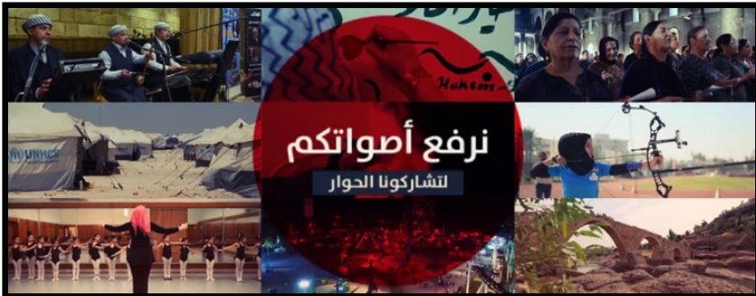
تصویر شماره ۷: کاور اصلی صفحه ارفع صوتک

شده است. در میان یکی از این تصاویر نوشته شده است: «صدایتان را بالا می‌بریم، برای گفتگو با ما در میان بگذارید.» در این تصویر عکس‌هایی وجود دارد که عبارتند از: نواختن موسیقی محلی توسط کردها، خطاطی توسط یک زن، مراسم دعای مسیحیان در کلیسا، اردوگاه کمیساریای عالی سازمان ملل متحد برای پناهجویان، ورزش تیراندازی با کمان توسط یک زن، ورزش ابروییک توسط کودکان دختر با یک مربی زن، شهربازی و یک پل تاریخی. مضامین این عکس‌ها اشاره به پارامترهایی از جامعه عراقی دارد که مورد توجه و تمرکز این صفحه آمریکایی قرار گرفته است.