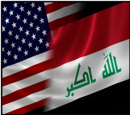
تصویر شماره ۱: