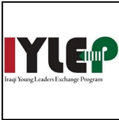
تصویر شماره ۱۰: پروفایل برنامه تبادل رهبران جوان عراق