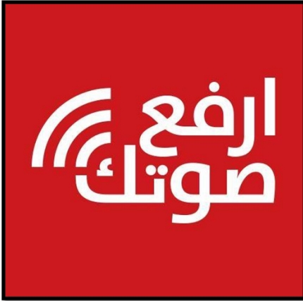
تصویر شماره ۶: پروفایل صفحه ارفع صوتک

تصویر پروفایل این صفحه دربردارنده نشان این کمپین است که شامل نام آن یعنی «ارفع صوتک» و خطوطی است که نماد رسانه‌ای و خبری بودن این تشکیلات است.