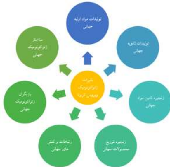
شکل ۱: مدل مفهومی تحقیق: تأثیرات ژئواکونومیک کرونا