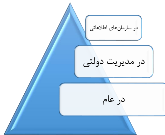
شکل ۱: معنای سیاست زدگی در سطوح مختلف (محقق ساخته)